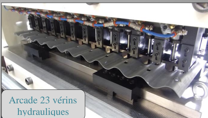
Arcade 23 vérins hydrauliques